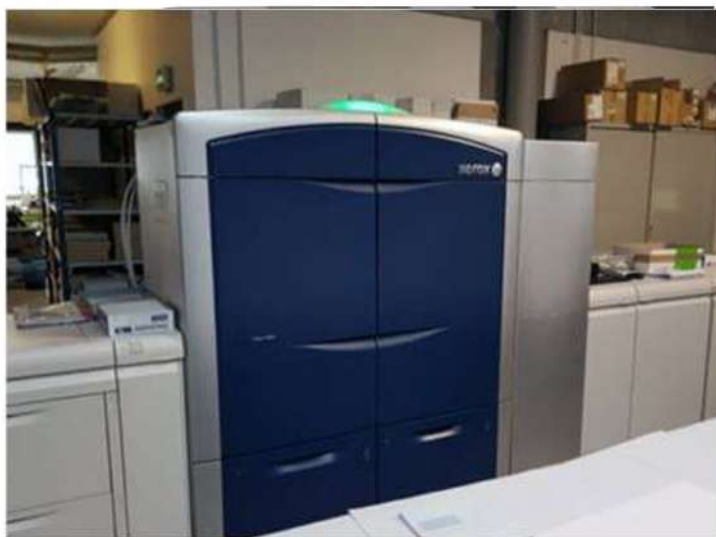
Reprocolor se sert de la Xerox Color 1000i pour imprimer avec un 5e toner or ou argent