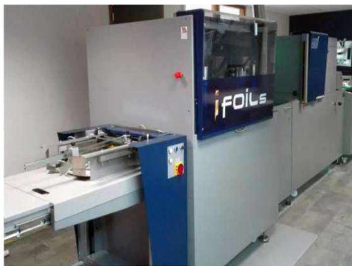
La presse numérique de MGI et Konica Minolta ajoute la dorure à chaud et le vernis texturé à l'offre de Reprocolor