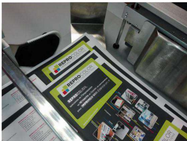
La nouvelle plaquette du reprographe ennoblie avec de la dorure à chaud argent